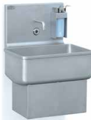
Con fotocélula. Mural. Sensor operated. Mural. RA00000809 COD. 401

Washbasin sensor operated or knee operated. Option floor mounted.