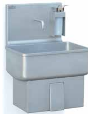
Accionamiento rodilla. Mural. Knee operated. Mural. RA00000811 COD. 328

Disponible AISI 316 L Available AISI 316 L